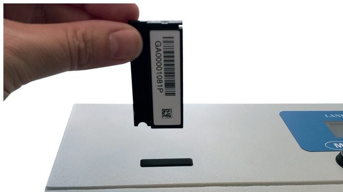
Positionnement d'un dosimètre InLight GA